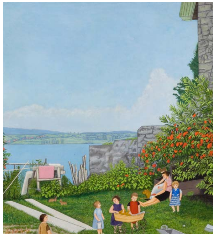
Adolf Dietrich: Garten am Untersee, 1931, Privatbesitz

Jede Veranstaltung endet mit einem Apéro im Garten von Adolf Dietrich mit Blick auf den See und die Höri. Es gibt kaum eine bessere Gelegenheit, im lockeren Gespräch mit anderen Gästen dem Schauen von Adolf Dietrich nachzuspüren.