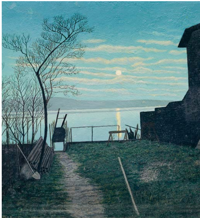
Adolf Dietrich: Mondscheinlandschaft, 1930, SKKG Winterthur