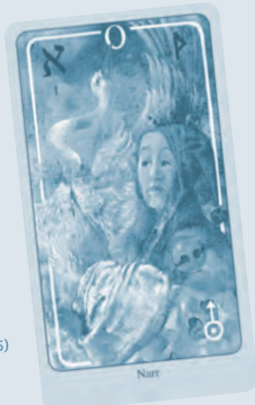
Der Haindl Tarot (1985)

Ragna Axen ist in persönlichen Begegnungen mit Hermann und seiner Familie eingetaucht und wird ihm und seiner Vision auf dem Festival erneut Gehör verschaffen. 2027 feiern wir 100 Jahre Hermann Haindl.