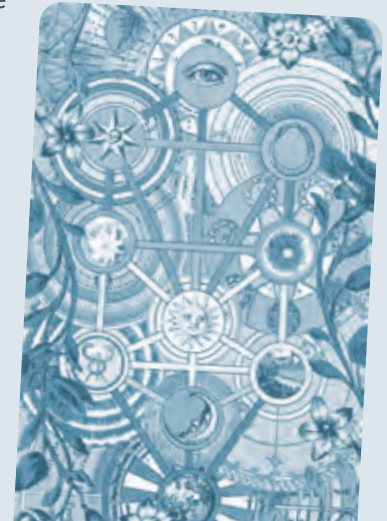
Tarot of the Holy Light (2011)

Er wird vermitteln, wie die Kabbala entstanden ist, wieweit sie im jüdischen Leben integriert ist, wie sie funktioniert und was davon für den Tarot-Interessierten umsetzbar ist.