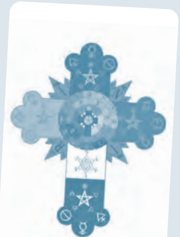
Rosenkreuzmotiv Thoth Tarot

In seinem Referat vermittelt er Einblicke in die Welt der mystischen Kabbala, die einen tiefen und zugleich praktikablen Zugang zu den Tarot-Bildern eröffnen. Dabei fokussiert er die Kabbala als „Landkarte“ der Energien, die jeder Mensch permanent aussendet und empfängt.